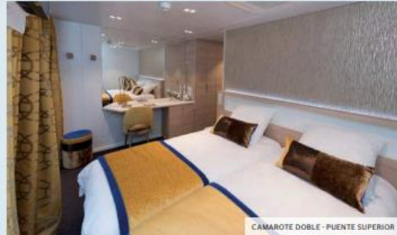
CÁMAROTE DOBLE - PUENTE SUPERIOR