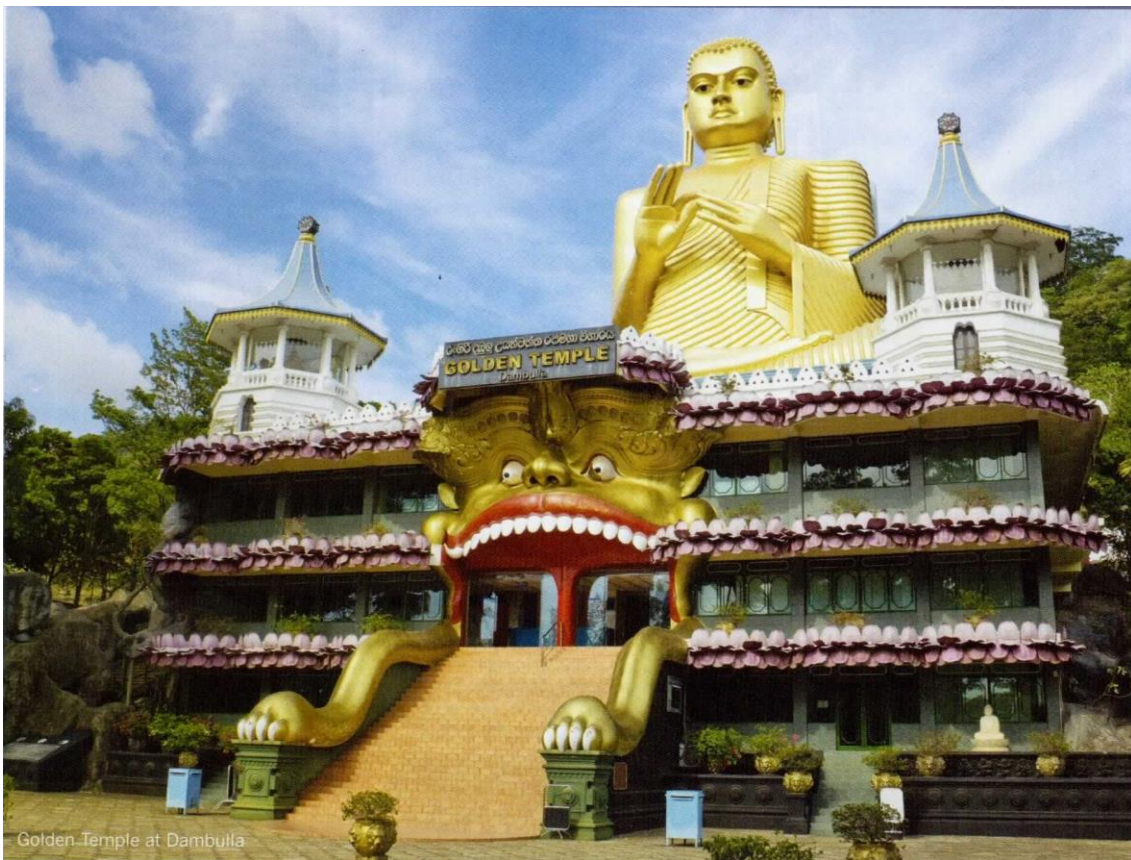
Golden Temple at Dambulla

“Viajar nos brinda recuerdos que duran toda la vida y las experiencias más increíbles para compartir. Pero ésta es solo la mitad de la historia, ya que los viajes y el turismo tienen un beneficio enormemente positivo para el mundo, mucho más allá del placer inmediato que brinda a quienes pueden explorar y descubrir personas, lugares y experiencias increíbles por sí mismos.”