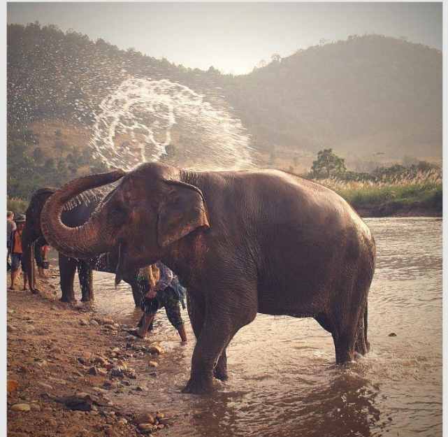
Bathing the elephants Elephant Nature Park, Chiang Mai

Después del desayuno ; partimos desde Chiang Mai por una escénica ruta a través de las espléndidas montañas tapizadas por la jungla tropical rumbo a Chiang Rai en un viaje que lleva unas tres horas de verde paisaje. En el camino nos detenemos a descansar en las termas cercanas al templo de Wat Rong Khun, el cual visitaremos seguidamente. Este templo también conocido como el templo blanco, donde famosos artistas y arquitectos tailandeses han dejado su particular impronta. Allí almorzamos en un restaurante local antes de continuar nuestro viaje. Por la tarde, traslado al muelle y paseo en barco por el río Mae Kok para visitar un pueblo de la tribu de la colina Karen. Regreso de vuelta en barco y traslado al hotel. Alojamiento.