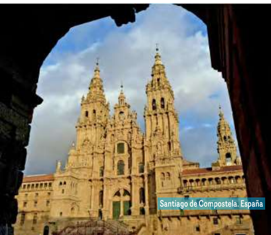
Santiago de Compostela. España